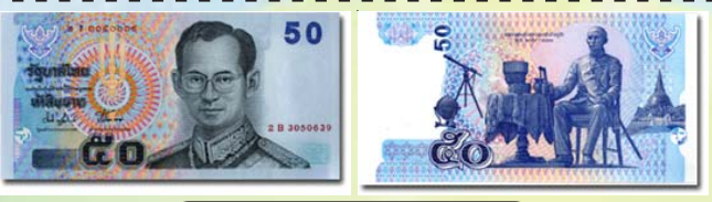
ธนบัตร ๕๐ บาท

ภาพประธานด้านหน้า พระบรมฉายาลักษณ์ของ พระบาทสมเด็จพระเจ้าอยู่หัว ทรงเครื่องแบบจอมทัพ ภาพประธานด้านหลัง พระบรมฉายาลักษณ์ พระบาทสมเด็จพระเจ้าจุลจอมเกล้าเจ้าอยู่หัว ทรงเครื่องแบบ เต็มยศทหารเรือ และภาพพระราชกรณียกิจ เกี่ยวกับการเลิกทาส