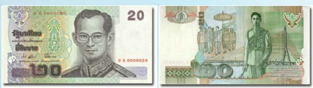
ธนบัตร ๒๐ บาท