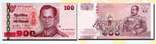
ธนบัตร ๑๐๐ บาท

ภาพประธานด้านหน้า พระบรมฉายาลักษณ์ของ พระบาทสมเด็จพระเจ้าอยู่หัว ทรงเครื่องแบบจอมทัพ ภาพประธานด้านหลัง พระบรมฉายาลักษณ์พระบาทสมเด็จ พระเจ้าอยู่หัวอานันทมหิดล ภาพพระราชกรณียกิจ เมื่อครั้งเสด็จพระราชดำเนินที่สำเพ็ง และภาพสะพานพระราม ๘