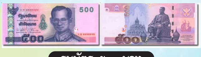
ธนบัตร ๕๐๐ บาท

ภาพประธานด้านหน้า พระบรมฉายาลักษณ์ของ พระบาทสมเด็จพระเจ้าอยู่หัว ทรงเครื่องแบบจอมทัพ ภาพประธานด้านหลัง พระบรมราชานุสาวรีย์ พระบาทสมเด็จพระเจ้าจอมเกล้าเจ้าอยู่หัว ณ กระทรวงวิทยาศาสตร์เทคโนโลยีและสิ่งแวดล้อม ภาพลูกโลกดาว กล้องโทรทรรศน์ และภาพพระปฐมเจดีย์ จ.นครปฐม